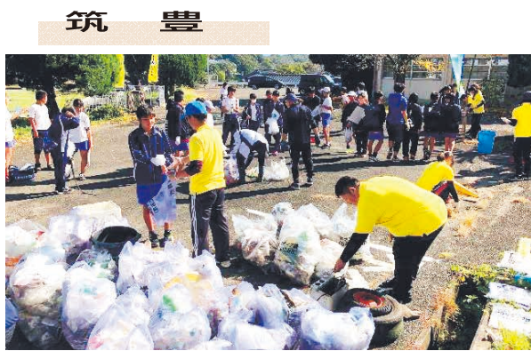
筑 豊 ウォークラリーでごみ回収 ●嘉麻市立碓井中

碓井中学校PTAでは20年以上前から、校区内の清掃活動「ウォークラリー大会」をサポートしています。この行事では、生徒とともに地域に出向いて資源ごみの回収など、清掃活動を行い写真(令和元年度撮影)、回収したごみを分別し、処理業者に回収していただいています。 少しでも落ち着いた学校生活を子どもたちが過ごせるため、地域の方々に子どもたちの頑張りを認めていただく取り組みにしようということで始めました。今ではこうした取り組みに他の機関の協力もいたるようになり学校と地域・保護者の連携