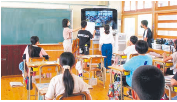
世界遺産学習で未来を創る ●大牟田市立駛馬小

駛馬小学校のある大牟田市は日本の近代化を支えたまちです。かつて日本一の石炭採掘量を誇った三池炭鉱は、「明治日本の産業革命遺産」として世界遺産に登録されました。校区内には、世界文化遺産の宮原坑があり、世界遺産学習を通じたESDを推進しています。令和元年度には、宮原坑での月一回の子どもボランティアガイドの実施や大牟田市主催の「炭の祭典／宮原坑フェスタ」において、これまでの学習成果発表として大牟田市世界遺産・文化財室や地域、PTAと連携し、「駛馬大学」を開講しました。本年度は6月に、福岡県世界