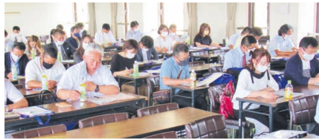
県Pの年間計画などの説明を聞く参加者

福岡県PTA連合会(県P)の令和3年度委員総会は、7月10日午後、糟屋郡篠栗町の県立社会教育総合センターで開催されました。コロナ禍を乗り越え、県Pの活動をけん引していく5つの委員会のメンバーが決定。それぞれの委員会の正副委員長が選出されて、委員会活動がスタートしました。