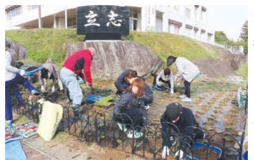
花を植えるPTAの皆さん