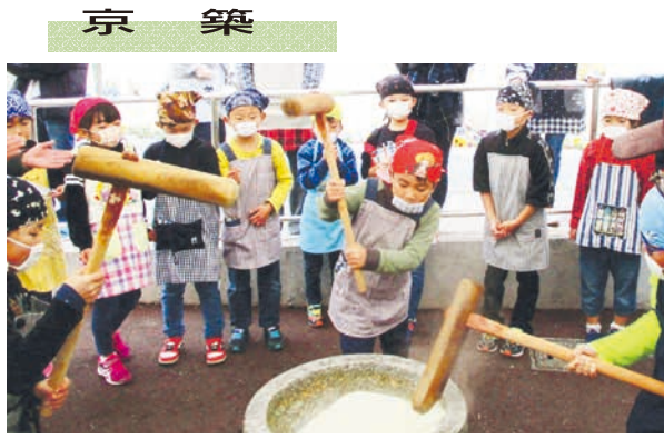
京 築 地域と共に楽しく子育て ●豊前市立山田小

山田小学校は、豊かな自然と歴史に囲まれた全校児童74人、家庭数53戸の小規模校です。本校PTAでは、地域の方々との交流やいろいろな体験を子どもたちにと、福祉施設との交流や講演会、バザー、いもほり、みかん狩り、バーベキュー、餅つき等を地域と連携して行っています(写真は、一昨年度の山田地域づくり協議会主催の餅つきの様子)。しかし、これらの行事は、新型コロナウイルス感染症拡大防止のため、昨年度から実施することができていません。多くの行事が中止されている中でも、PTA生活委員会を核とし、新家庭教育宣言