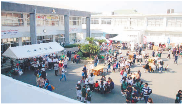
ハンパない！PTA友愛バザー ●糸島市立前原中

前原中学校では、学校・地域・保護者が連携し「PTA友愛バザー」＝写真＝毎年開催しています。そのハンパない内容は…。 その一。地元企業や商店からの協賛がハンパない！商品や飲食店で使用できる金券など、優に百を超える物品が毎年集まります。体育館で販売してPTAの活動資金に充てたり、ステージイベントで子どもたちへの景品として使用したりしています。 その二。保護者以外の来場者がハンパない！その歴史は古く、今年で22回目を迎えます。もはや学校行事の域を超え、地域