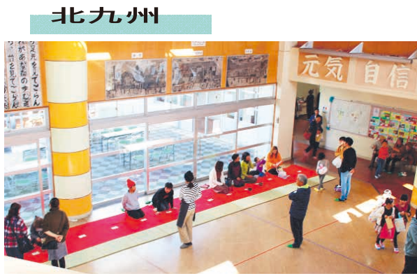
北九州 笑顔で語り合えるバザー ●直方市立福地小

福地小学校は、全校児童115人、PTA会員は、80世帯の学校です。明治5年に創立し、今年150年の歴史を持つ伝統ある学校です。地域の特徴は、福智山の麓に位置し、自然豊かな環境に恵まれた地域です。地域と児童のつながりも深く、さまざまな伝統的な行事に児童も積極的に参加しています。PTA活動については、役員や理事を中心に熱心に活動を行っています。昨年度は新型コロナウイルス感染症拡大防止のため活動はできませんでしたが例年行っている活動を紹介いたします。 家庭教育委員会を中心に行っている福地