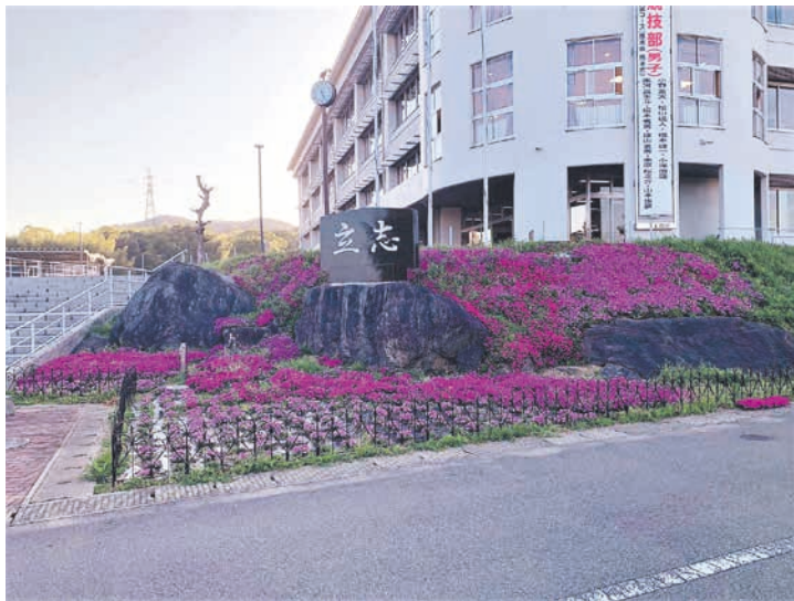
宮若東中の校門前に続く花壇