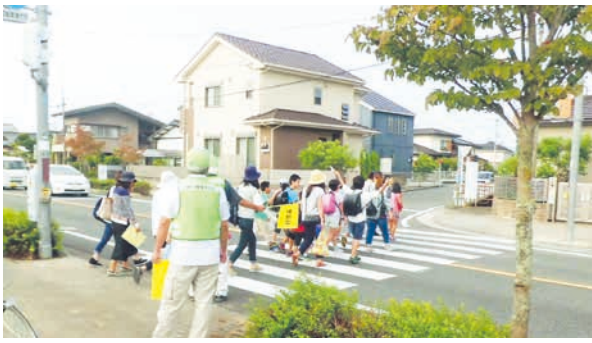
提案を生かして主体的な活動 ●小郡市立大原小

昨年度から感染症対策などでPTA活動を縮小している状況ですが、子どもたちへの思いが伝わる取り組みを紹介します。 昨年度、緊急事態宣言による休校が明けると、ある保護者や地域の方から「旗一番（見守り）は、してもいいかね？」とお尋ねがありました。当時、感染予防の方法が少しずつ浸透してきている状況でしたので、「お願いできますか？」とお答えすると「当たり前。しましよ」とうれしなお返事がありました。その一言がきっかけとなり、各子ども会での定期的な見守りも継続していただくことになりました。写真。地域