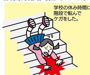
学校の休み時間に階段で転んでケガをした。

学校内外でのケガや、偶然な事故による法律上の損害賠償責任などさまざまなリスクを補償します。