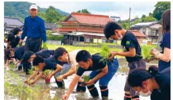
田植えで土と触れ合う