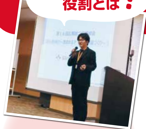
講話では、PTA広報紙と学年・学校だよりの役割の違い、企画の見つけ方など、広報紙づくりの基本を学ぶことができました。