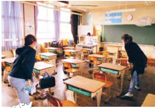
PTAによる校内除菌の様子