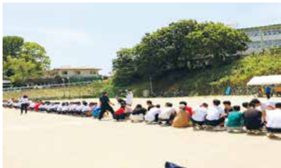
白熱した運動会の綱引き