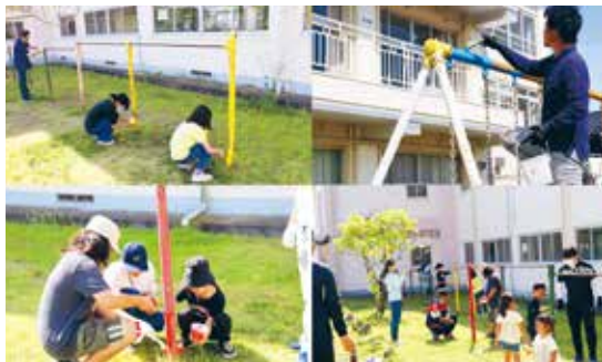
親子で楽しくペンキ塗り