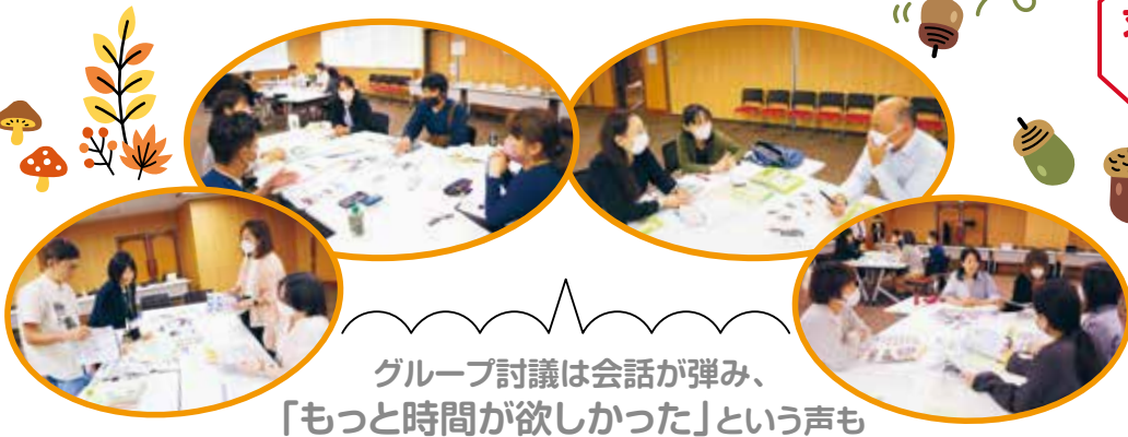
グループ討議は会話が弾み、「もっと時間が欲しかった」という声も