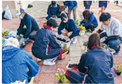
地域の方と一緒に花植え活動