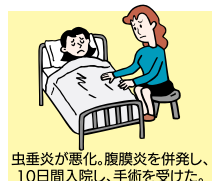
虫垂炎が悪化、腹膜炎を併発し、10日間入院し、手術を受けた。