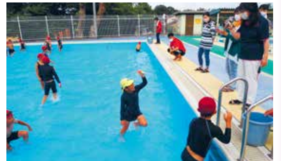
プールで行う伝統の「鮎のつかみ取り」