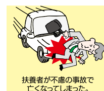
扶養者が不慮の事故で亡くなってしまった。

さらに、おさまが病気になった時の補償や、おさまの持ち物の補償、扶養者の方に万が一があった時の補償など、多くの補償でおさまをお守りします。*