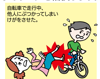
自転車で走行中、他人にぶつかってしまいケガをさせた。

さらに、おさまが病気になった時の補償や、おさまの持ち物の補償、扶養者の方に万が一があった時の補償など、多くの補償でおさまをお守りします。*