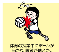
体育の授業中にボールが当たり、眼鏡が壊れた。